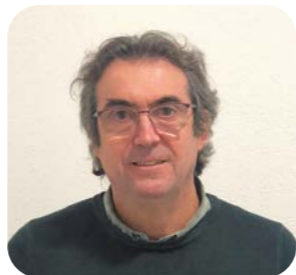
Albert Canal Vocal Empresa: Nat's Polígon: Riu d'Or - Casa Nova