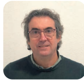
Albert Canal Vocal Empresa: Nat's Polígon: Riu d'Or - Casa Nova